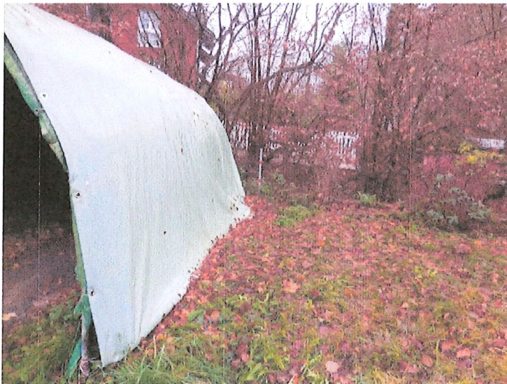
Uferstreifen und Gestaltung der Gemeinde