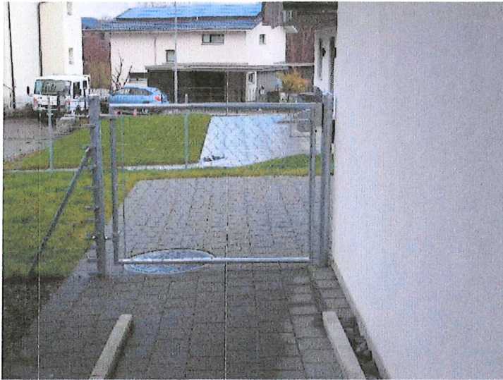
Eingangstor in der Verlängerung der Rollstuhlrampe